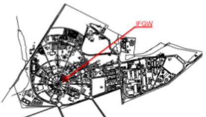
PLANTA DE LOCALIZAÇÃO NO CAMPUS Sem Escala